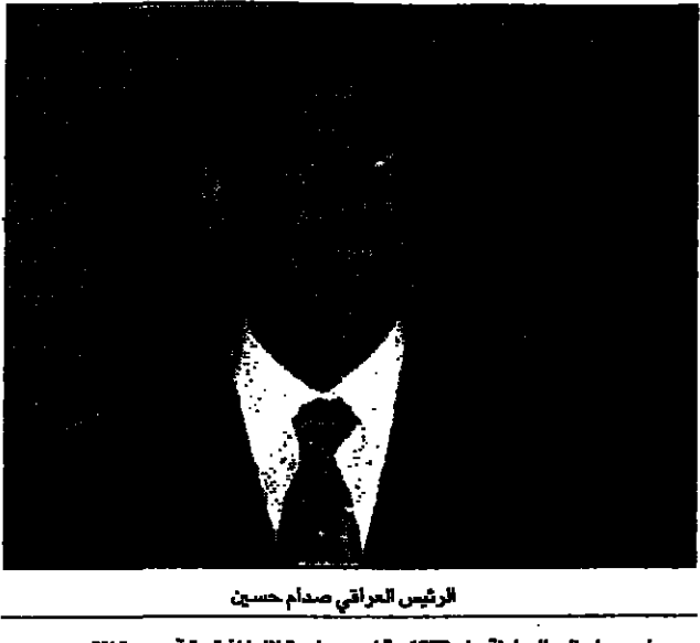
الرئيس العراقي صدام حسين

بغداد - من سامية نخول: قال الرئيس العراقي صدام حسين ان الولايات المتحدة خسرت مكانتها في عين العرب والسلمين رغم قدراتها العسكرية والسياسية. وقال صدام في خطاب نشرته الصحف العراقية امس الخميس انه في احدى محاضراته عن العرب والسلمين كانت الولايات المتحدة تشارك على ان تهب الحياة او تهتها. واستمر صدام قائلا في خطابه الذي القاها بعد ان تلقى رسالة من الرئيس السعودي عن عرس الرئيس ان الولايات المتحدة بكل ما فعلته في العراق من اجلها فقد فقدت مكانتها في عين الأمة العربية. وقال صدام ان الحكام العرب خريجي المدارس الأجنبية، وهم الذين جعلوا من العراق مسرحا لعملياتهم المدمرة، وقال انهم لم يهتموا بالمشاكل الحقيقية للشعب العراقي، بل اهتموا بالثروة الشخصية. واستمر صدام قائلا ان الحكام العرب خريجي المدارس الأجنبية، وهم الذين جعلوا من العراق مسرحا لعملياتهم المدمرة، وقال انهم لم يهتموا بالمشاكل الحقيقية للشعب العراقي، بل اهتموا بالثروة الشخصية.